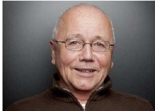
البروفيسور/ أنطوان بيلي، جامعة جنيف