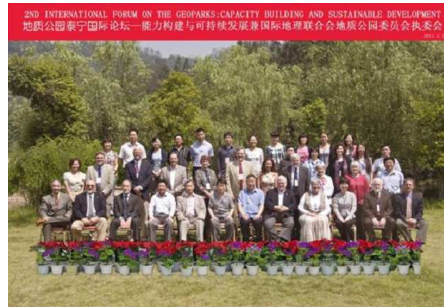
صورة جماعية للمشاركين

عقد المنتدى الدولي الثاني للحدائق الجيولوجية وكان موضوعه بناء القدرات والتنمية المستدامة بنجاح في الحديقة الجيولوجية العالمية بتاينينج، بمحافظة فوجيان بالصين في الفترة من السابع والعشرين إلى التاسع والعشرين من مايو ٢٠١١م.